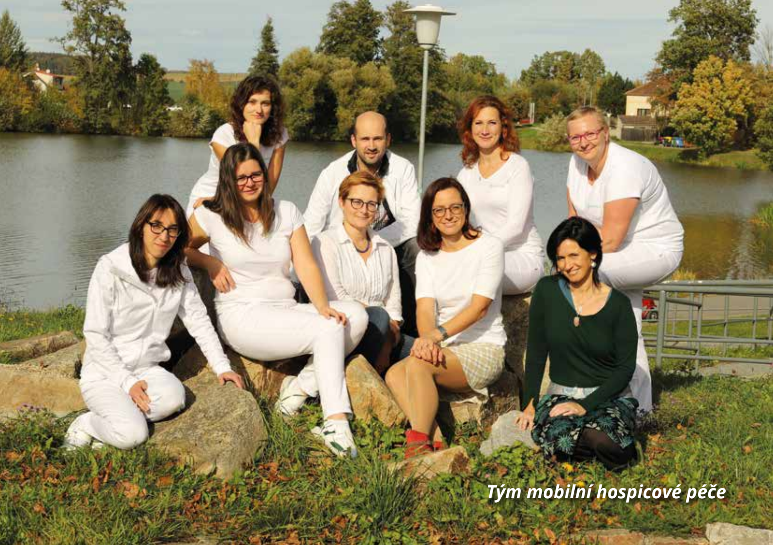
Tým mobilní hospicové péče