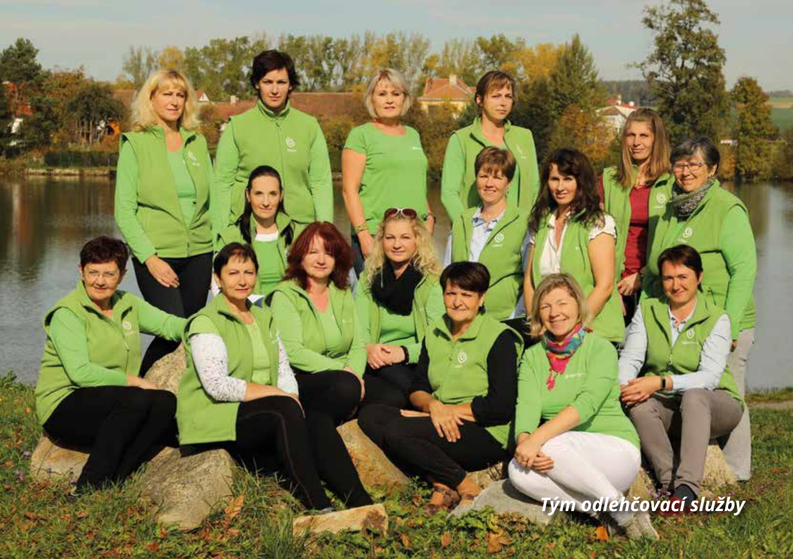
Tým odlehčovací služby